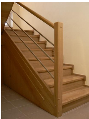
obložení schodišťových stupňů